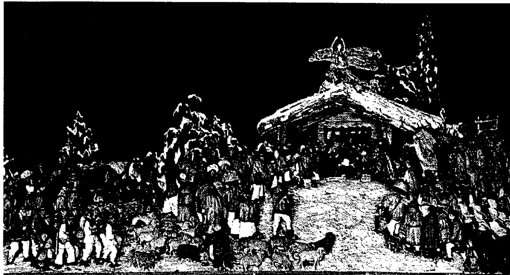
JASLICE U CRKVI SV. BLAŽA U ZAGREBU

Antonín Přidal, Lidové noviny, vánoce 1993