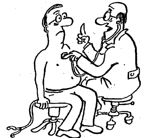
Pane Růžička, žádná kouřeni, káva ani alkohol a hlavně žádná spekulace na burze! Kresba pro RT - J. Dostál

Državni proračun Češke republike za 1994. godinu zaključen je s viškom od 11,2 milijarde kruna, izjavio je predsjednik vlade Václav Klaus. Prihodi državnog proračuna iznosili su 389,5 milijardi kruna, što je 7,7 milijardi više od predviđenih, a rashodi 378,3 milijarde kruna ili 3,5 milijarde manje nego što je predviđao proračun koji je odobrio parlament.